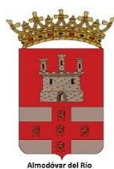
Almódovar del Río